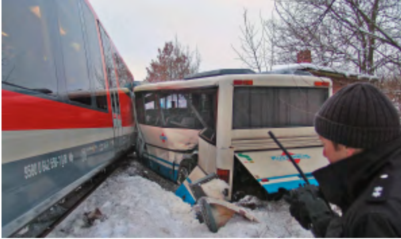
Dem beherzten Handeln des Küstenbus-Fahrers ist es zu verdanken, dass etwa 30 Schüler rechtzeitig aus seinem Setra-Gelenkbus fliehen konnten.

Am Mittwoch ist ein Zug von DB Regio der RE-Linie 8 Wismar – Tessin nahe Kröpelin (Bad Doberan) auf einen Bus geprallt. Im Zug gab es vier Leichtverletzte, die Triebwagenführerin erlitt einen Schock. Die Insassen des gerammten Küstenbusses blieben